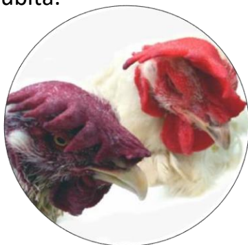
Ave com crista cianótica (esquerda) e com crista normal (direita)

As aves apresentam crista cianótica, diarreia amarelo esverdeada, febre, prostração e morte súbita.