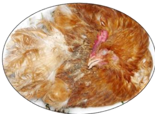
Aves em decomposição (mortalidade por Tifo Aviário)

O Tifo Aviário é uma doença de fácil transmissão. Aves mortas em decomposição, falta de higiene na granja, presença de moscas e roedores são as principais formas de disseminação do agente entre as aves.